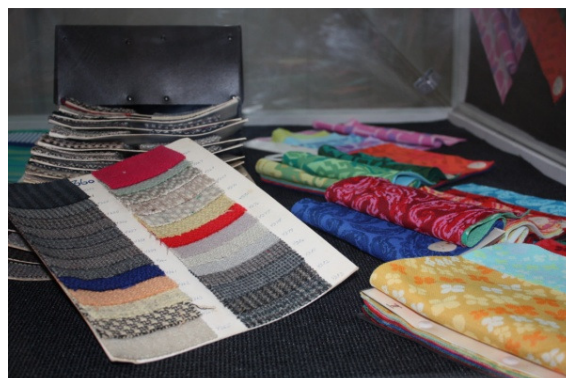
Textilforum havde været en tur i arkiverne for at tilrettelægge en lille inspirerende udstilling med smagsprøver fra sit righoldige arkiv af tekstiler og stoffer fra den lokale tekstilindustri.