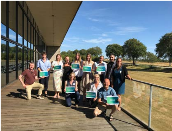
Det første kollektive forløb er sat i gang og består af et netværk af fem modige og ambitiøse virksomheder fra mode- og tekstilbranchen: Samsøe Samsøe, Son of A Tailor, Kentaur, HVISK og Belle.