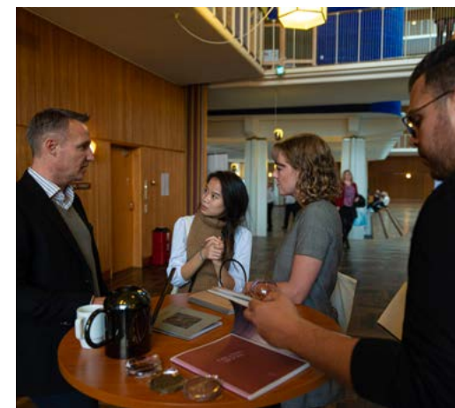
Dimittender & studerende ved Karrieredag

Adskillige virksomheder og flere hundrede dimittender og studerende deltog virtuelt og dannede grundlag for gode dialoger og fremtidige ansættelser, da Karrieredagen for tredje gang blev afholdt - denne gang i en online version. Målet med denne dag er at samarbejde om rekruttering og fastholdelse af arbejdskraft samt på skabe kontakt og dialog mellem etablerede virksomheder og dimittender/studerende. Læs mere her .