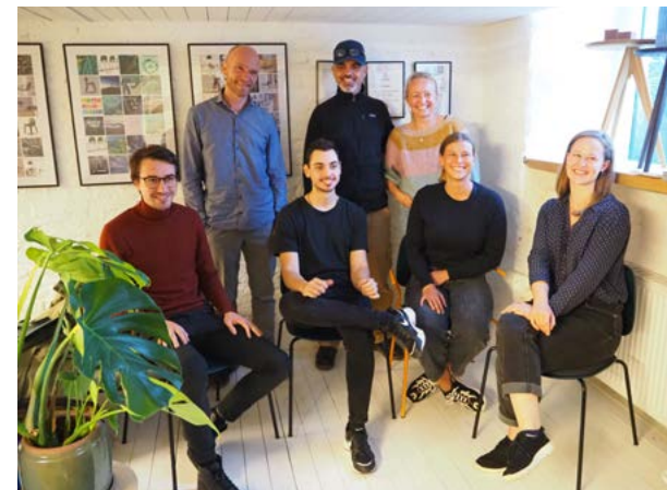
Spin In team hos Wehlers

Deltagende virksomheder: Coster Copenhagen, Minimum, Pilgrim A/S, Liiteguard, Horn Bordplader A/S, Gardin Lis, Planet Bee, By Green Cotton, Wehlers og PP Møbler.